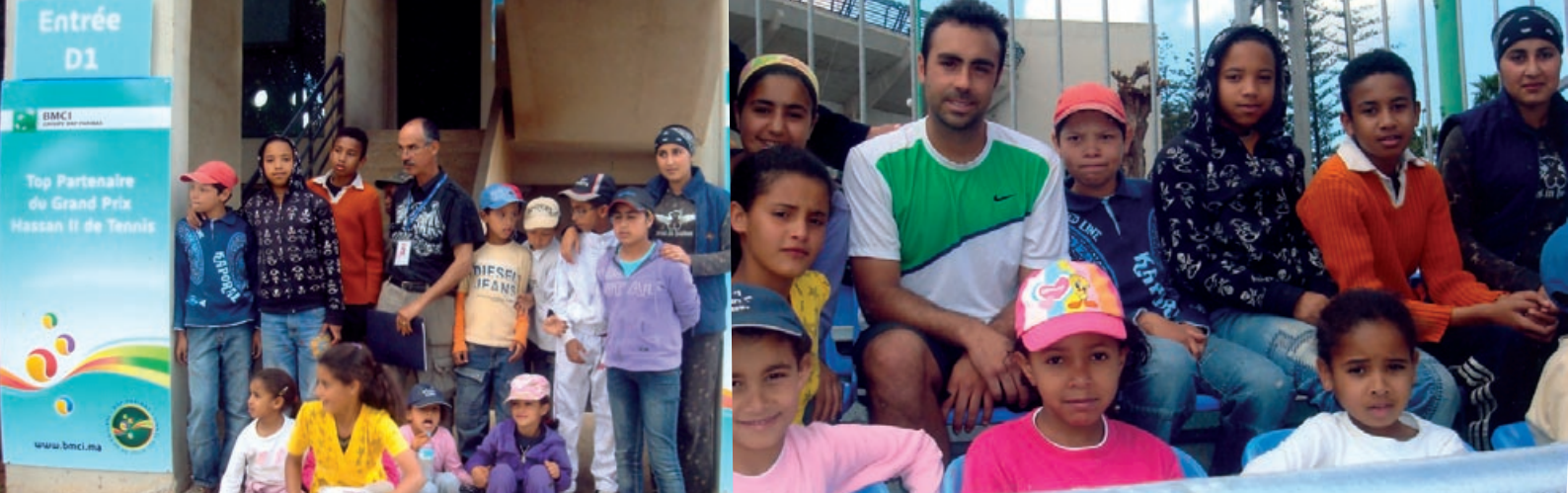
Les jeunes de l'Association Socio-Culturelle Al Madina (M. Samorah - Coup de Pouce), ravis d'assister aux matchs de qualification du Grand Prix Hassan II de Tennis.