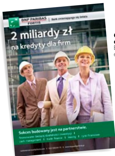
Campagne de publicité de BNP Paribas Fortis en Pologne.

la Belgique (où la banque opère désormais sous la marque BNP Paribas Fortis) et le Luxembourg (sous la marque BGL BNP Paribas). Ce rapprochement lui permet également de s'implanter en Pologne, vaste marché de l'Union européenne relativement épargné par la crise, et de renforcer sa présence en Turquie. Moins de dix ans après la fusion entre BNP et Paribas, et après l'acquisition en 2006 de la banque italienne BNL, la prise de contrôle de Fortis constitue une nouvelle étape cruciale, à la fois dans le développement international du Groupe et pour l'étendue de ses activités de Banque de Détail.